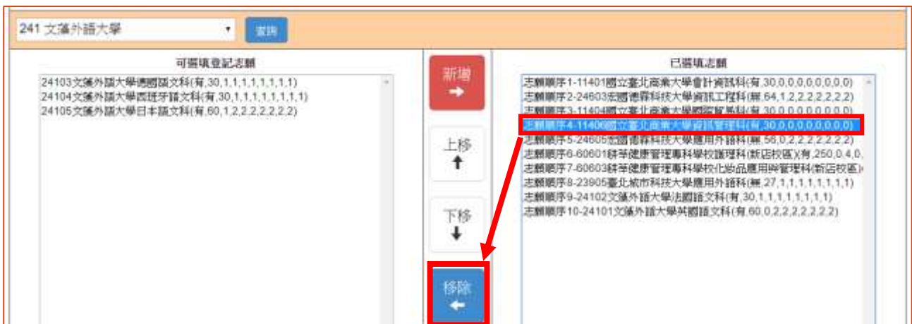
圖 18 刪除志願-「移除」按鈕之畫面