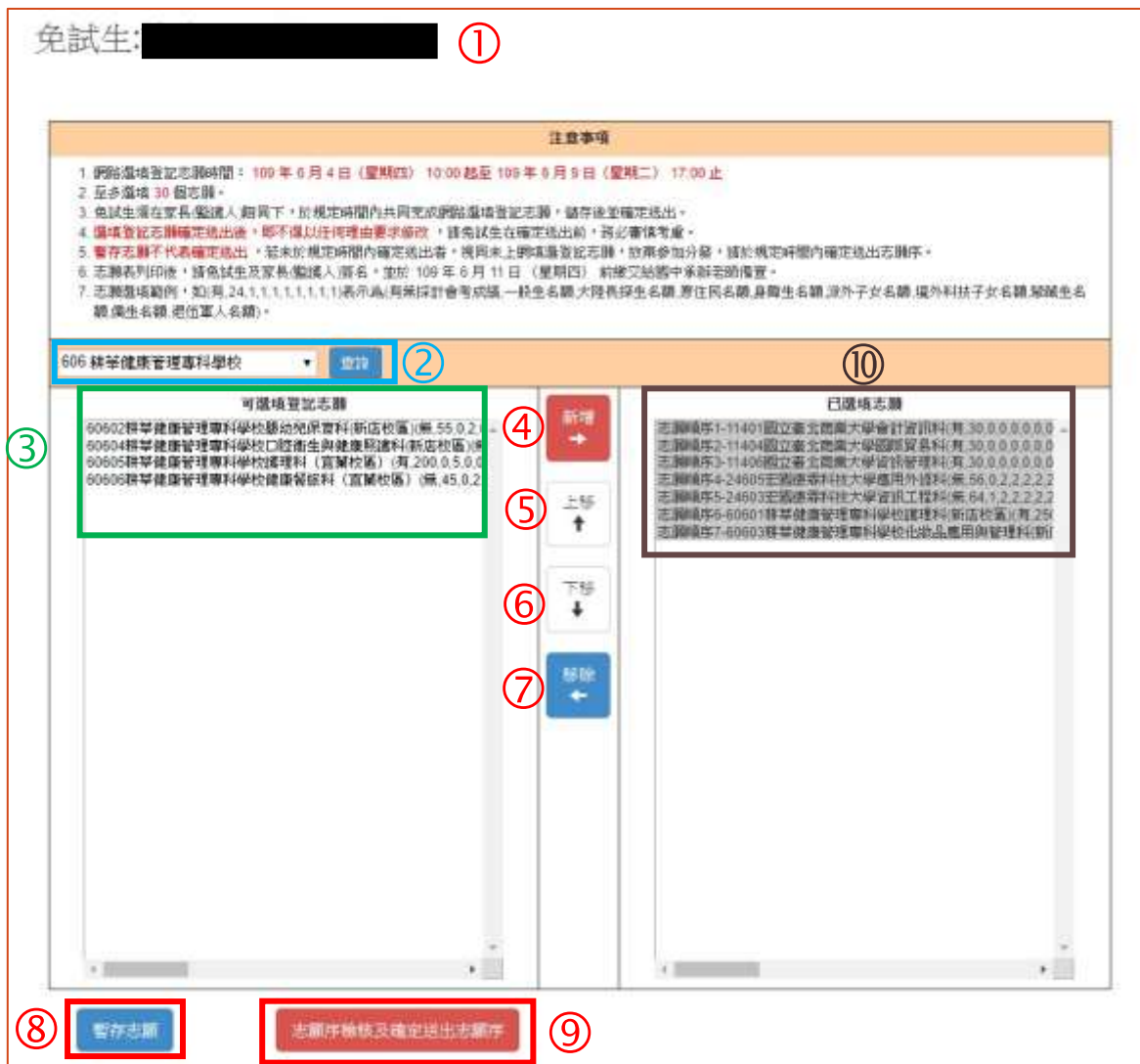
圖 10 網路選填登記志願之主畫面

2.若免試生已詳細閱讀重要訊息後，點按「確定」，即進入下一頁作業，選填登記志願主畫面(如圖 10 所示)，各項功能說明如下：