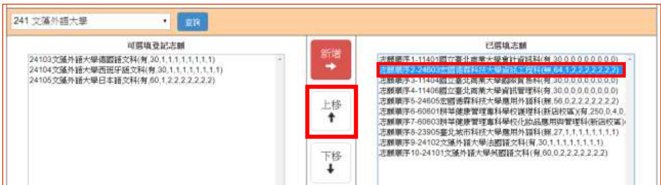
圖 17 調整志願順序後之畫面