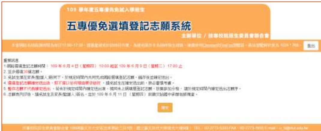
圖 9 選填登記志願重要訊息之畫面

1.進入志願序選填系統後，出現選填登記志願重要訊息(如圖 9 所示)，請免試生詳細閱讀「重要訊息」，以免權益受損。