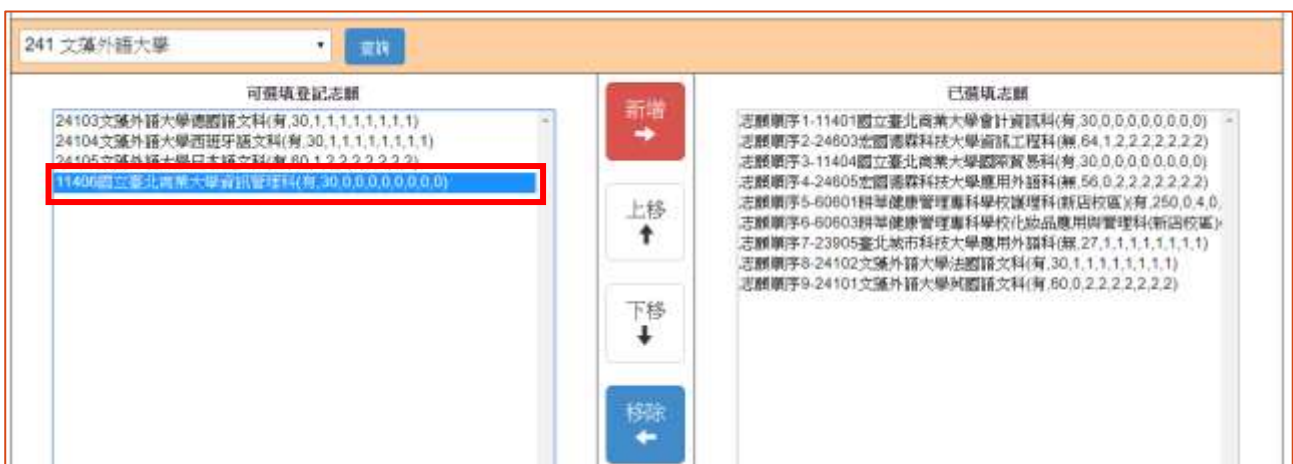
圖 19 刪除 1 個志願後「可選填登記志願」清單之畫面