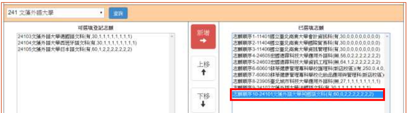
圖 15 新增 1 個志願後「已選填志願」清單之畫面

2.免試生可經由點選「上移」或「下移」按鈕(如圖 16 所示)，進行「已選填志願」清單內的志願順序排列操作。