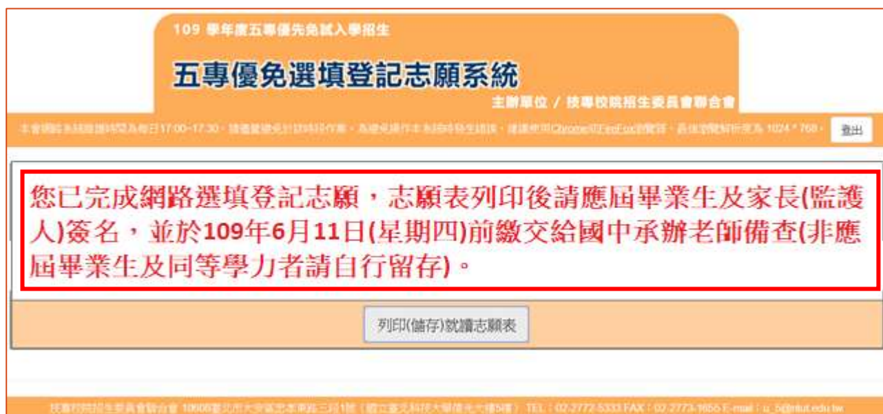
圖 24 完成志願確認動作後之畫面

完成志願確定送出動作之後，畫面將出現：您已完成網路選填登記志願，請自行「列印」、「儲存」就讀志願表(如圖 24 所示)，代表考生已成功完成網路選填登記志願。