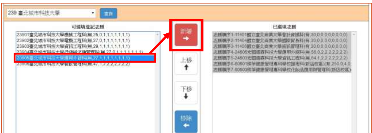
圖 11 新增志願之畫面

在「可選填登記志願」清單內，選取欲選填的志願後，點選「新增」按鈕，即會將所選之校科(組)志願加入右方志願欄內，如圖 11、圖 12 所示。