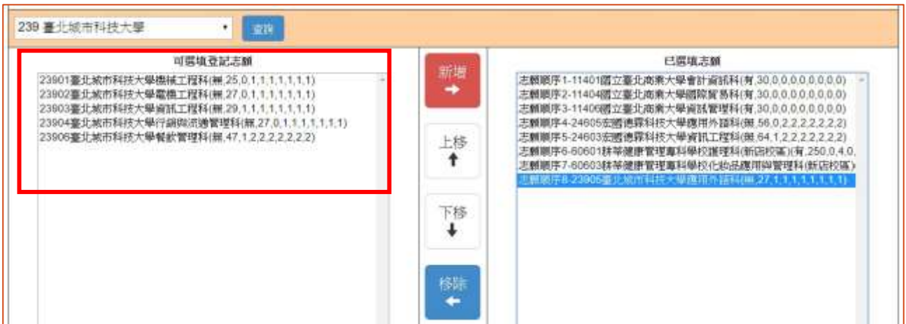
圖 13 志願已選取後 科(組)志願清單之畫面