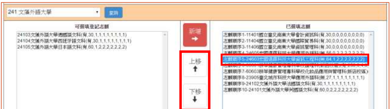
圖 16 「調整志願順序」按鈕之畫面

例如：目前停留在「已選填志願」內的志願項目為志願順序 5-24603 宏國德霖科技大學資訊工程科(如圖 16 所示)；此時將志願序上移：志願順序 2-24603 宏國德霖科技大學資訊工程科(如圖 17 所示)。