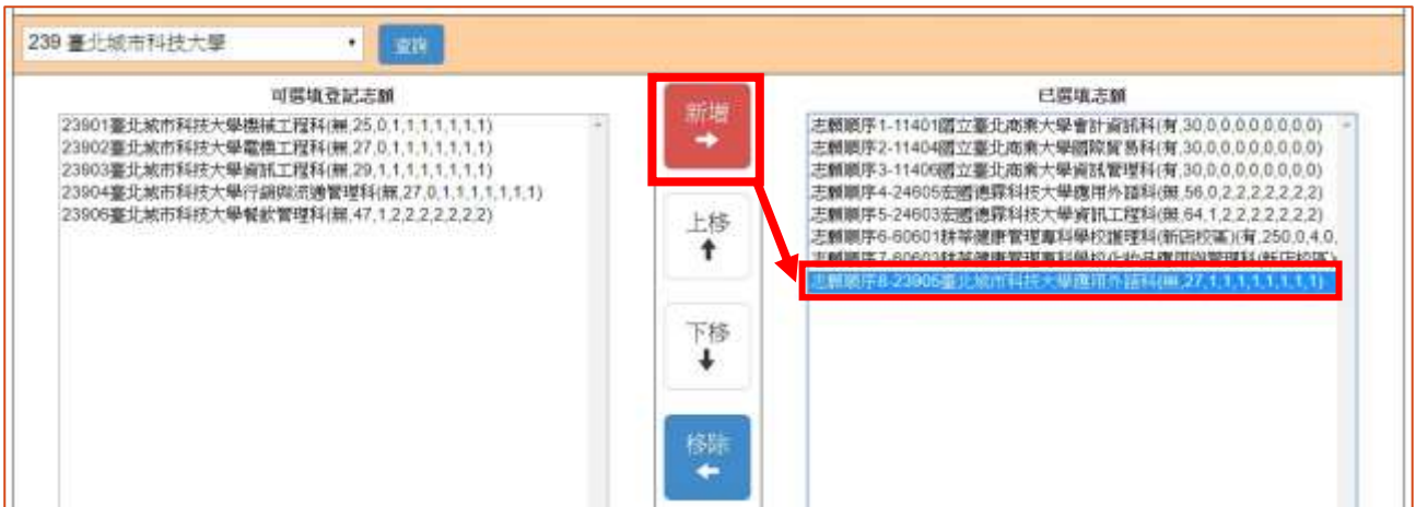
圖 12 新增志願後之畫面